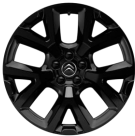
Jante aliaj Full Black 19" ART (Tall & Narrow) (205/55 R19) (ZHNY)