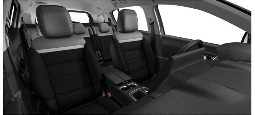
Tapiterie mixta Wild Black (V4FC)