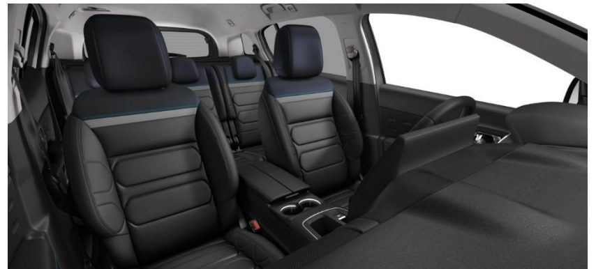
Tapiterie piele Hype Black (U0FO)