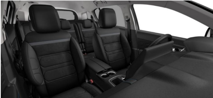
Tapiterie mixta Urban Black (0JFD)